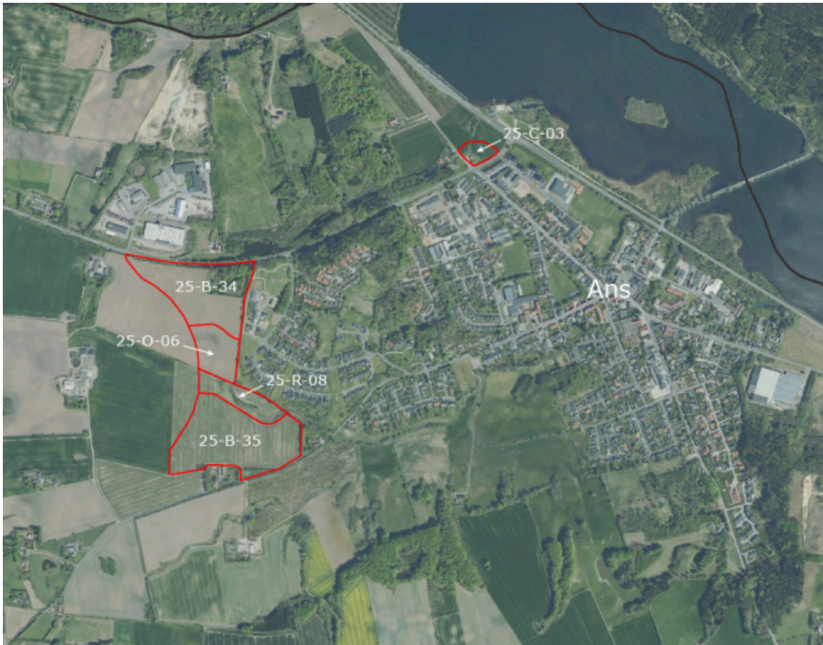
Oversigtskort med angivelse af nye kommuneplanrammer i forslaget.