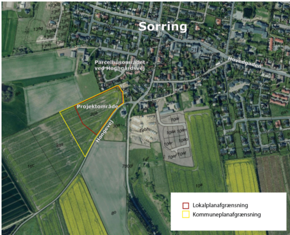
Oversigtskort med markering af hhv. kommuneplanrammens og lokalplanens afgrænsning