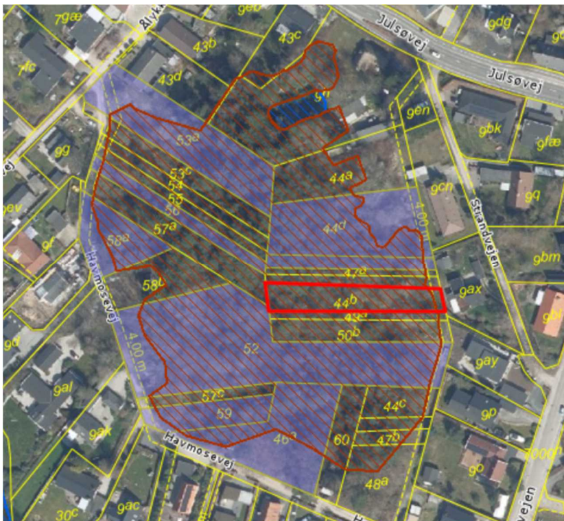
Ejendommen Strandvejen 6H er markeret med rød indramning.