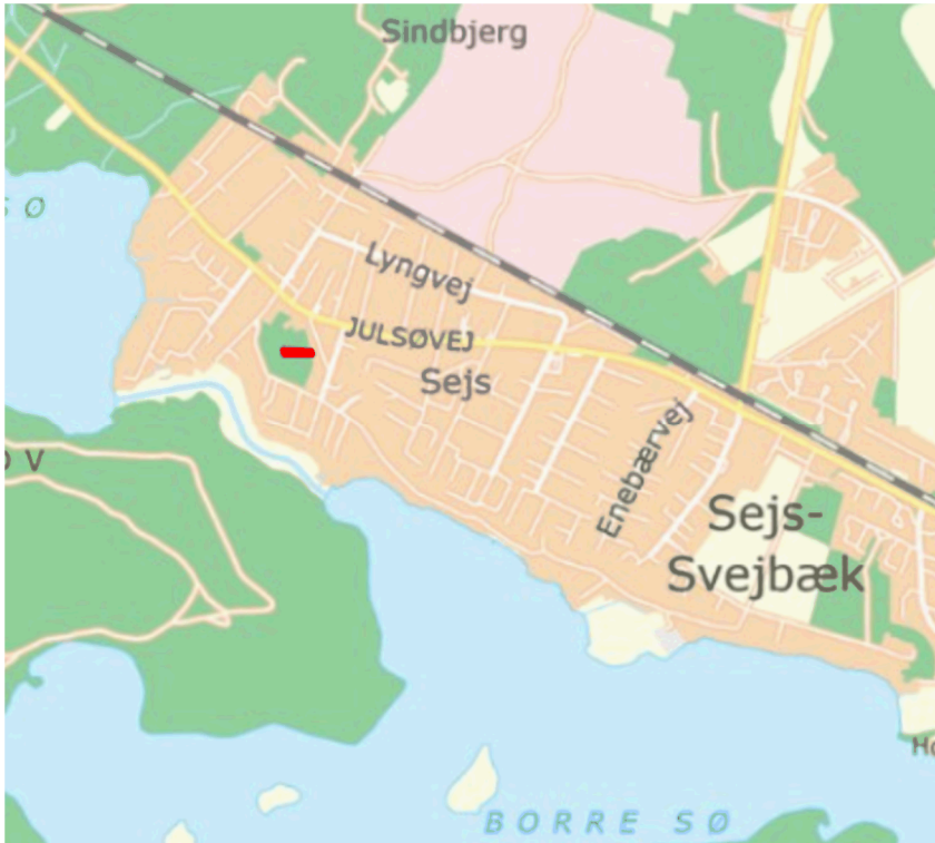
Oversigtskort. Ejendommen Strandvejen 6H er markeret med rødt.