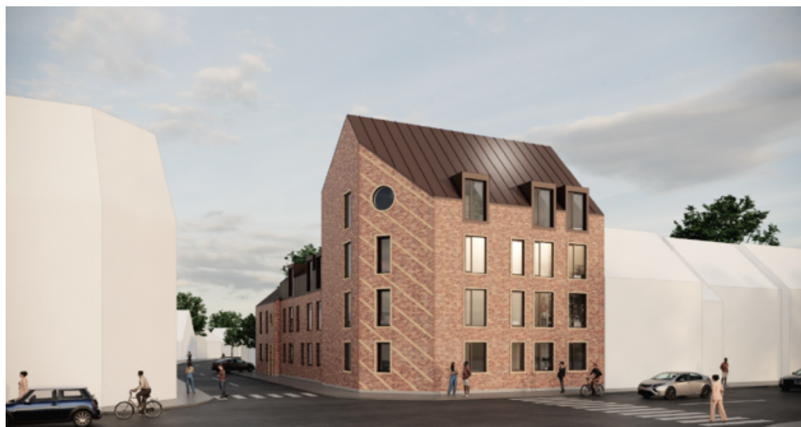
Visualisering af boligforeningens ønskede projekt indeholdende 16 boliger