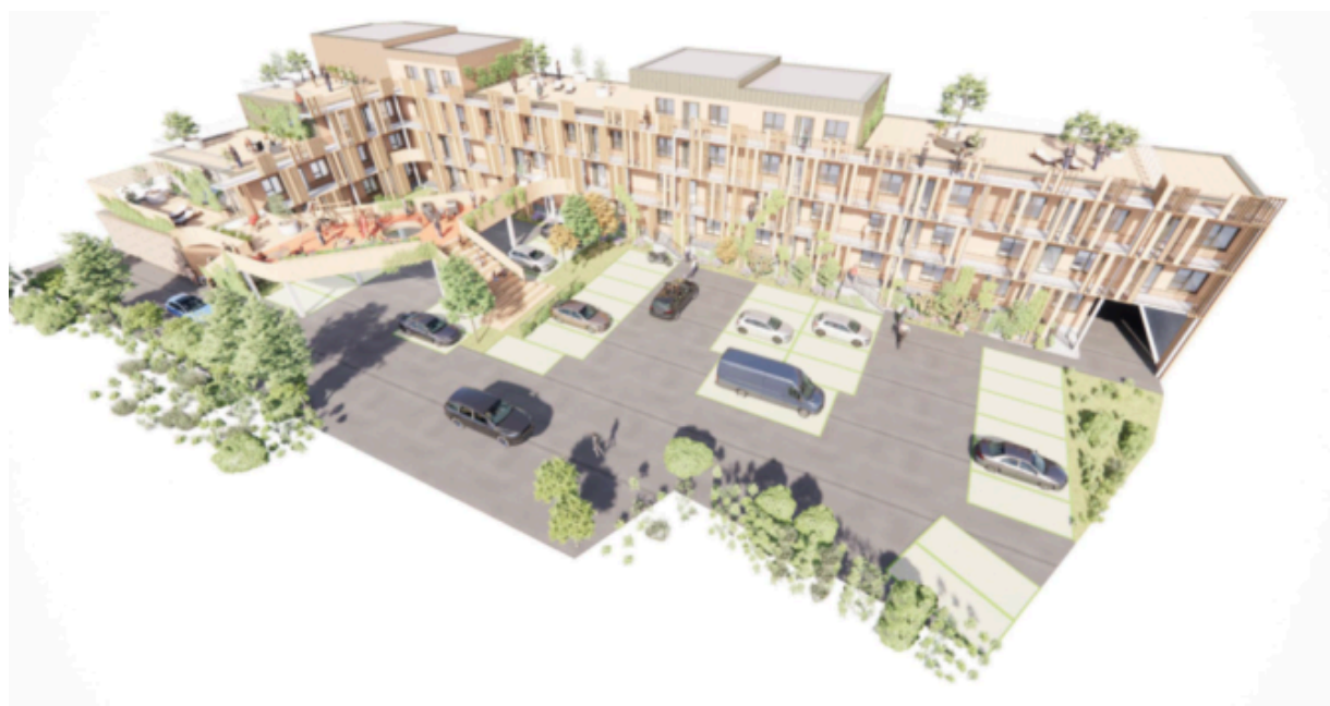
Visualisering af det sydlige boligprojekt indeholdende 35 boliger