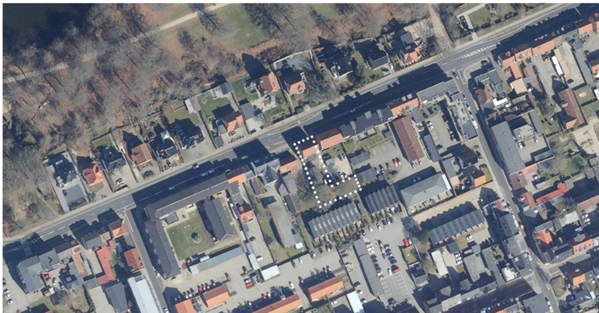
Oversigtskort over lokalplanområdets afgrænsning og sammenhæng med bebyggelse på Vestergade.

Plan- og Vejudvalget igangsatte 7. februar 2023 udarbejdelse af planforslaget på baggrund af det forbud mod nedrivning af ejendommen Vestergade 81B, jfr. planlovens § 14, som byrådet på mødet 19. december 2022, besluttede at nedlægge.