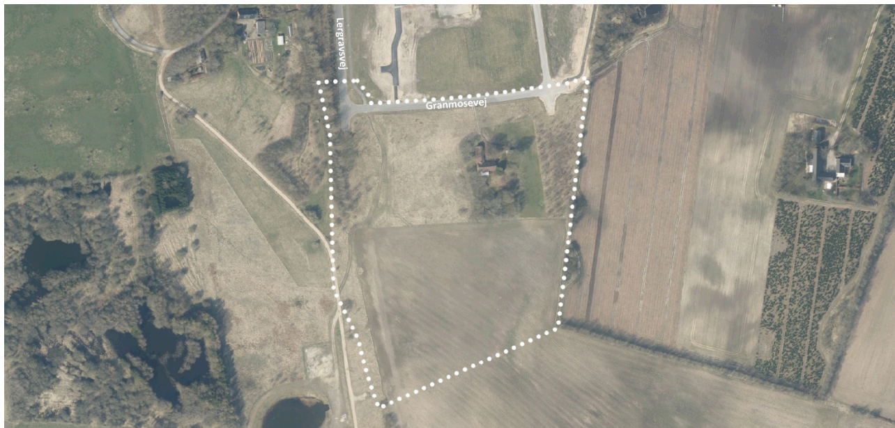
Oversigtskort over lokalplanområdet. Lokalplanområdet er vist med hvidprikket afgrænsning.

Der har været forhøring med indkaldelse af idéer og forslag til planlægningen i perioden 12. maj 2022 – 30. maj 2022. Der er modtaget 2 hørings svar.