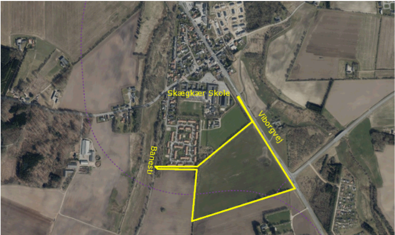
Lokalplanområdet er markeret med gul streg

Daginstitutionen skal placeres i den nordvestlige del af lokalplanområdet. Det placerer institutionen længst muligt væk fra hhv. Viborgvej og evt. kommende omfartsvej pga. trafikstøj.