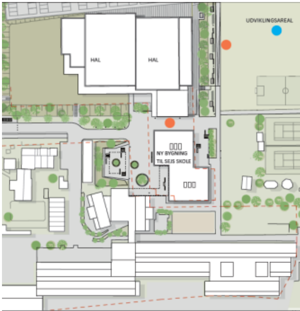
Illustration: Udvidelse af Sejs Skole