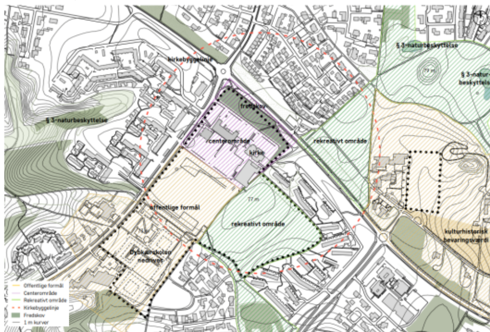
Illustration af området omfattet af Helhedsplanen

Bevillingen på 0,5 mio. kr. vil blive benyttet til udarbejdelse af udbudsmateriale til nedrivningen samt miljøundersøgelse af bygningsdele, herunder kortlægningsrapport, prøver og analyser. Ydermere vil bevillingen kunne klarlægge et estimat på den samlede omkostning ved nedrivning af skolen.