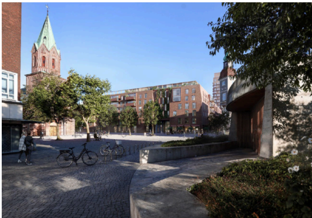
Visualisering af restauranten som ansøgt