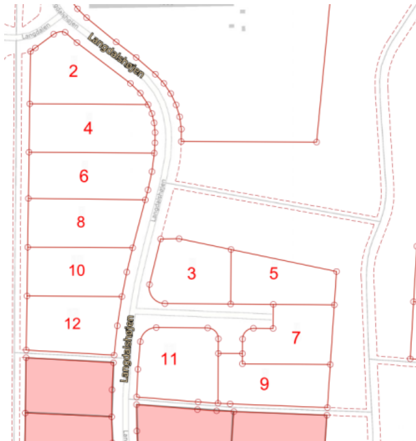
Kort med adresser