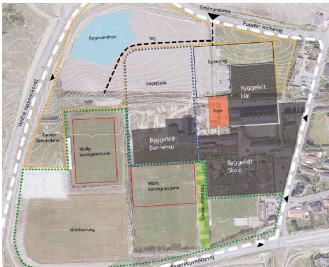
Figur 1 Kort over placeringer i Områdestudie Funder fra 2019