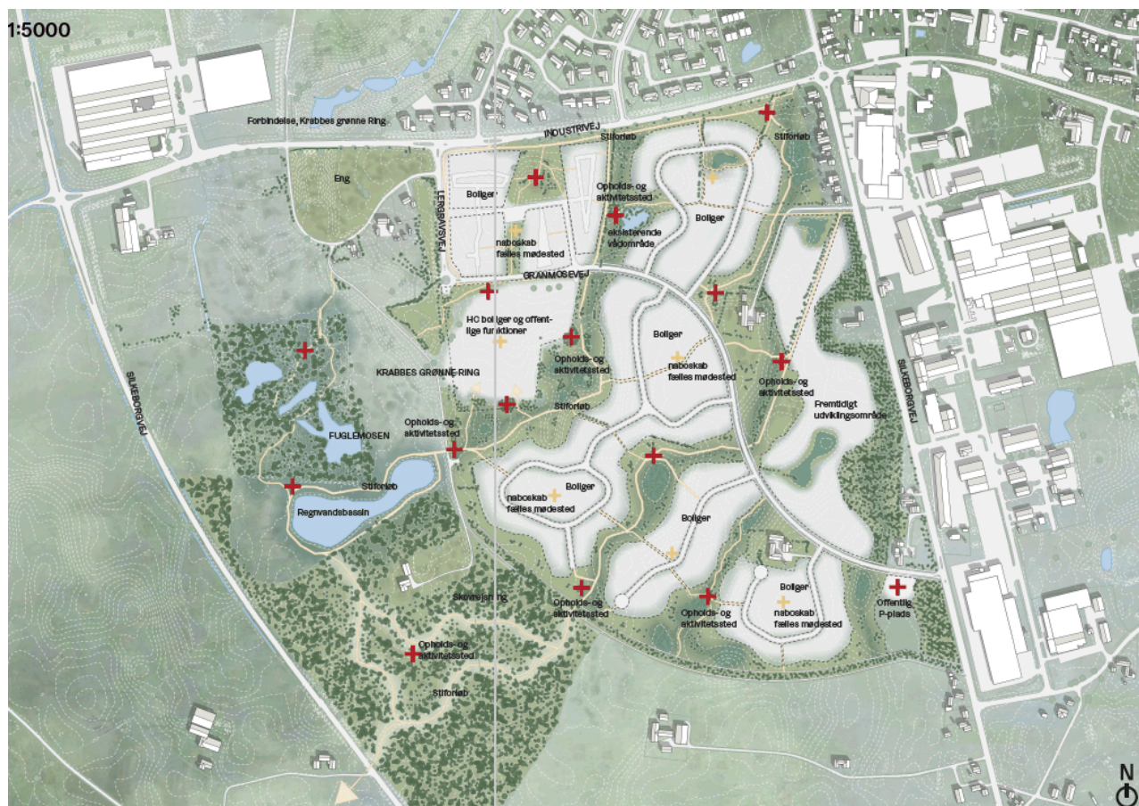
Strukturplan for Helhedsplan for Kjellerup SV. De røde krydser angiver mulige nye mødesteder og vigtige ankerpunkter i planen.

grøn struktur, plan for regnvandshåndtering, samlet plan for infrastruktur og peger på fremtidige byggeområder til offentlige formål og boliger. Den overordnede strukturplan, der viser, hvordan udviklingen overordnet kan disponeres i fremtiden, er vist herunder.