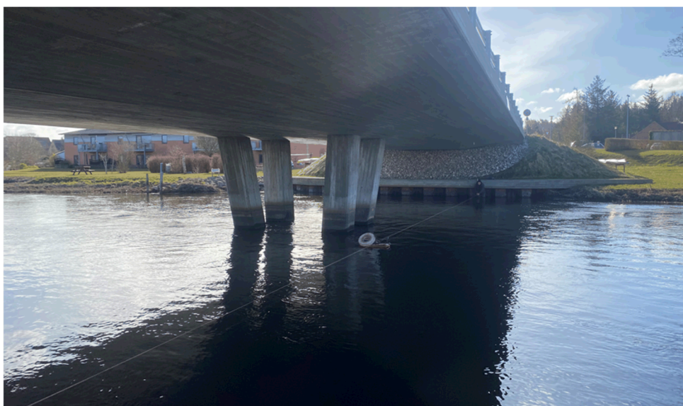
Foto. Måling af vandføring ved Resen Bro april 2022.

Rapporten med bestemmelse af årets vandføringsevne er ikke modtaget på tidspunkt for udsendelse af dagsordenen, men vil blive fremlagt på mødet.