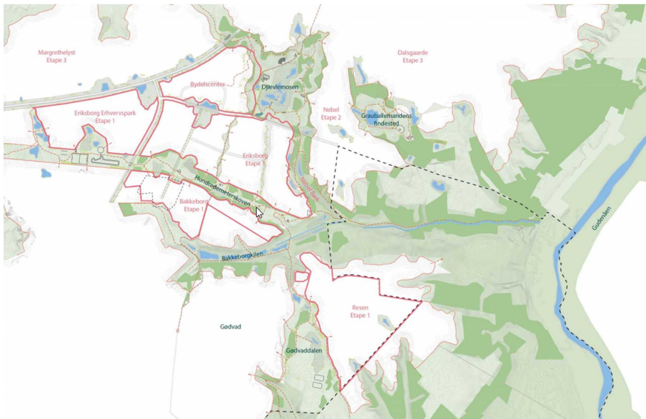
Figur 1: Nye kloakoplande (etape 1) markeret med rødt.

Byrådet har tidligere besluttet, at regnvand skal håndteres på terræn, så vidt det er teknisk muligt. Åbne regnvandsløsninger er med til at skabe en større naturmæssig og rekreativ værdi i området, samtidig med at løsningerne er mere klimarobuste end traditionelle regnvandsløsninger i rør.