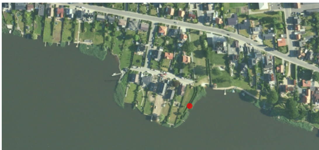
Illustration af det ansøgte indsendt af foreningen.

Luftfoto over området. Matriklen hvor broen ønskes er markeret med rød plet.