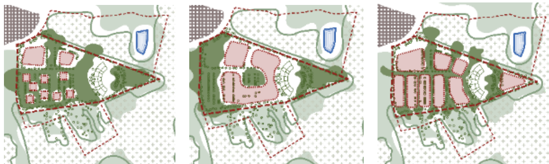
Scenarie A 'Satellitterne'

Det følgende er en kort præsentation af de tre scenarier. Læs Lytt Architectures præsentation af scenarierne i bilag 2.