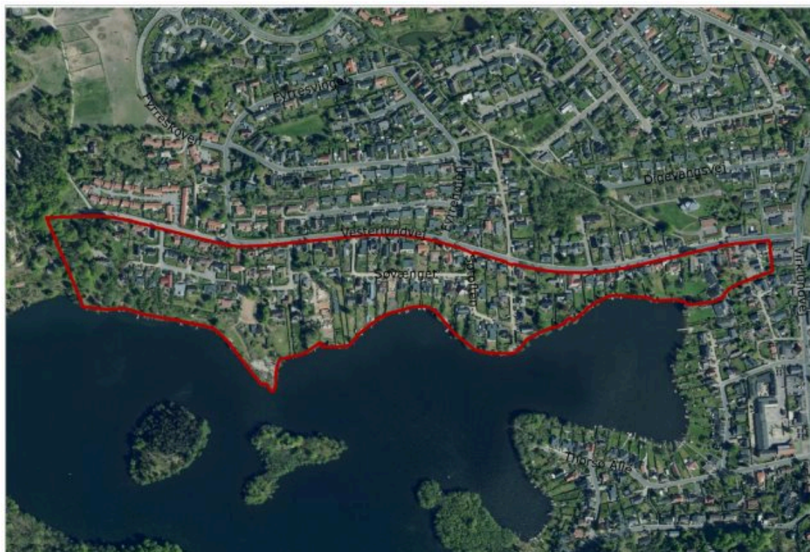
Oversigtskort, lokalplanafgrensning vist med rød markering