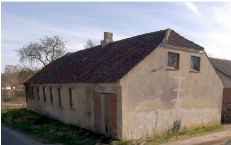
Foto af ejendommen Linågyden 7

Ejendommen beliggende Linågyden 7, 8600 Silkeborg er oprindeligt opført som rytterskole i omkring år 1727 og bliver derfor kaldt Rytterskolen.