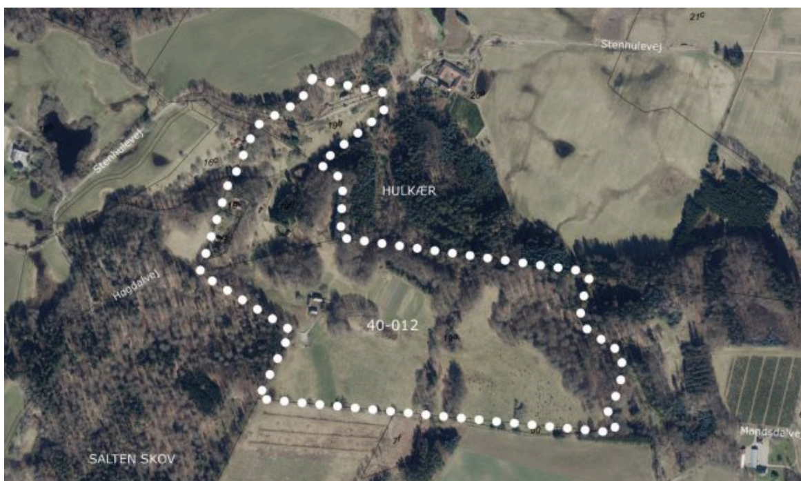
Oversigtskort der viser afgrænsningen af den bevarende lokalplan 40-012 for kulturmiljøet Høgdal ved Salten/Them.

Da området omfattet af lokalplanen ligger i landzone og forbliver i landzone ved lokalplanens endelige vedtagelse, er det en lokalplan med bonusvirkning.