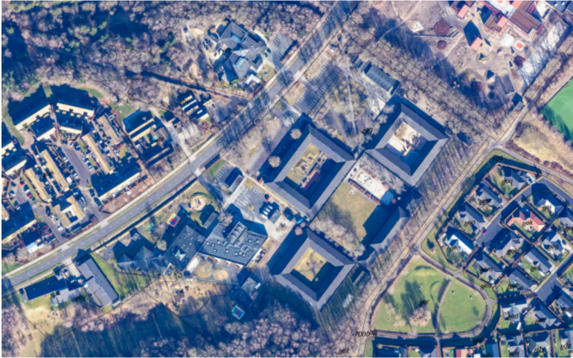
Luftfoto over området