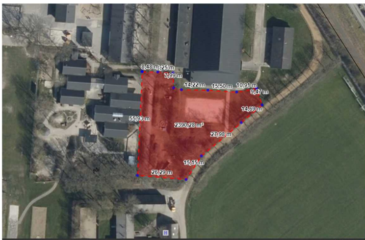
Figur 1: anbefalede placering for 40 børns udvidelse i Skæggær

Ved denne placering er det muligt at samtænke udvidelsen med det eksisterende børnehus hvad angår bl.a. personale og legeplads.